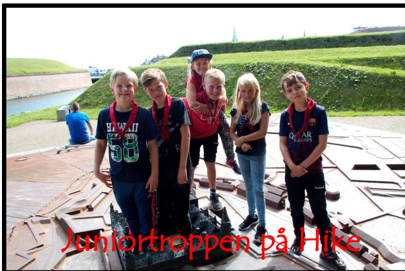
Juniortroppen på Hike

Juniortroppen på Sommerlejr Troppen på Sommerlejr