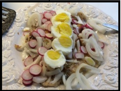
Stegte sild med æg – det tog 40 min. at "koge" ægget indpakket i en våd avis)