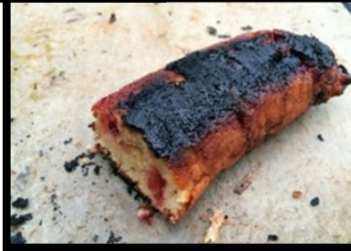
Sandkage med blomme, bagt i gryde (det "sorte" på toppen er karamelliseret kanelsukker)