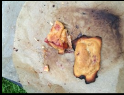
Tærte med nektarin – bagt i gryde.

Alle klanens kulinariske eksperimenter var denne gang vellykkede.