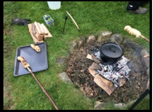
Snobrød med Kanelsukker