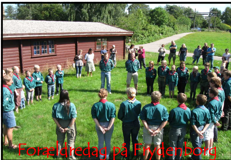
Forældredag på Frydenborg