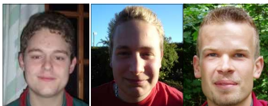
The Dream Team

Men lige for at runde af; som jeg skrev på side 6, så ville det være rigtig rart hvis der var nogle fra de forskellige enheder som gad skrive en kort historie om en oplevelse på lejren. Billeder er også meget velkommende og igen ville det være godt hvis i ville skrive bare en linje eller to i word til hver billede.