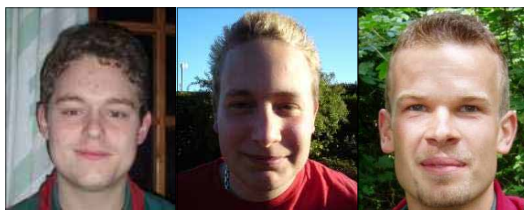
The Dream Team