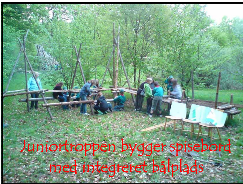
Juniortroppen bygger spisebord med integreret bålplads