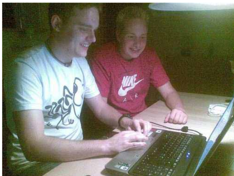
(den nye redaktion)