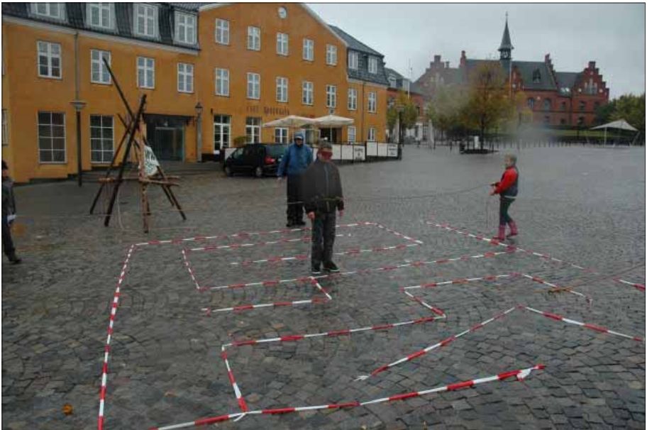
Labyrint på Torvet i forbindelse med gruppens byløb