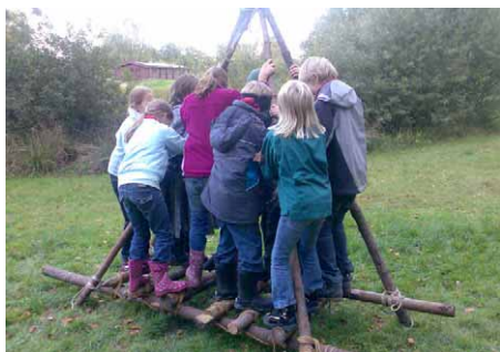
Juniorerne kontrollerer besnøringer - raften knækkede først!