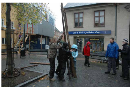
På trods vejret skulle der pioneres på byløbet