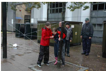
Smidighed i regnvejret