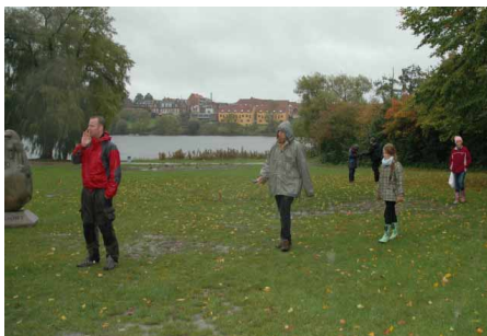
Kompassgang på Posen