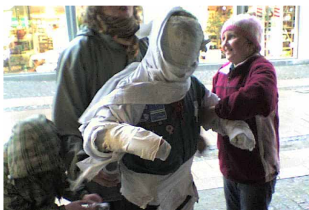
Mumificering på byløbet