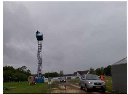
Indkørslen på en regnvåd torsdag

Vejrguderne viste sig i år fra deres gode side, bortset lige fra torsdag, da vi havde sol og skyfri himmel fra fredag til søndag! Dette har helt sikkert været med til at skabe det flotte resultat i madboden, hvorimod antallet af biler skuffede lidt... Men der er nok mange der har taget cyklen i det flotte vejr.