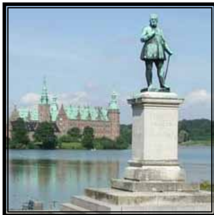
Frederik d. 7. på Torvet

Undervejs vil I opleve Hillerød by fra helt nye vinkler og lære byen bedre at kende.