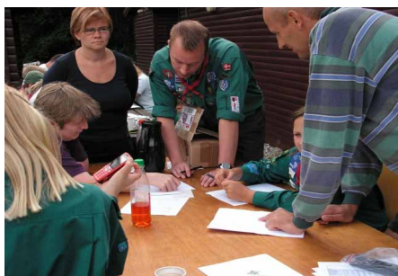
Kodeløsning på forældredagen