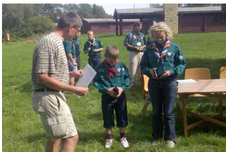
Uddeling af gavekort til supersælgerne af rundskuehæfter