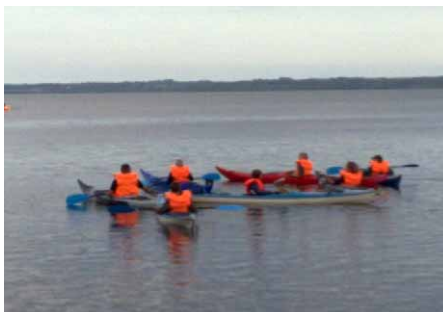
Tropen var ude og sejle i kajak på Esrums Sø.