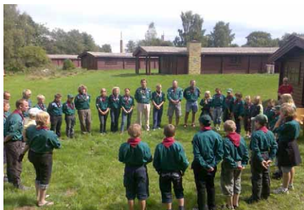
Oprykning på forældredagen