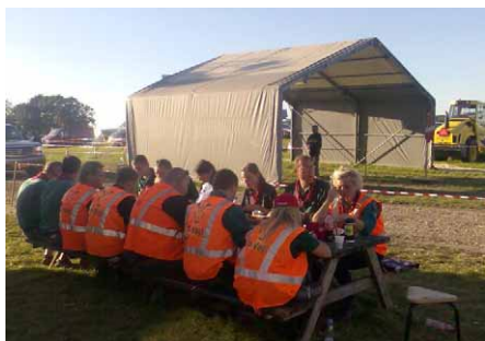
Middagsmad på kræmmermarkedet