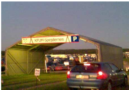
Vores nye indkørselsskilt som klanen har fremstillet