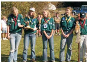
De sejrende Svaler fra Sct.Georgsløbet 2006